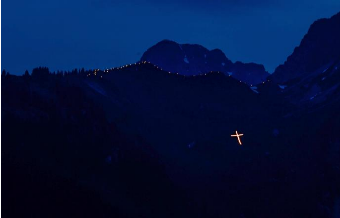
Sonnwendfeuer auf Fahren-Ziersch:

Wir bedanken uns bei allen Mitwirkenden , dass sie dieses tolle Erlebnis mit so viel Aufwand organisiert haben! Die hell erleuchteten Bergkämme samt den Kreuzen waren ein herrlicher Anblick!